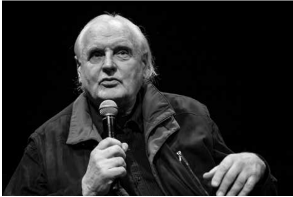
Kompozitorius Feliksas Bajoras.