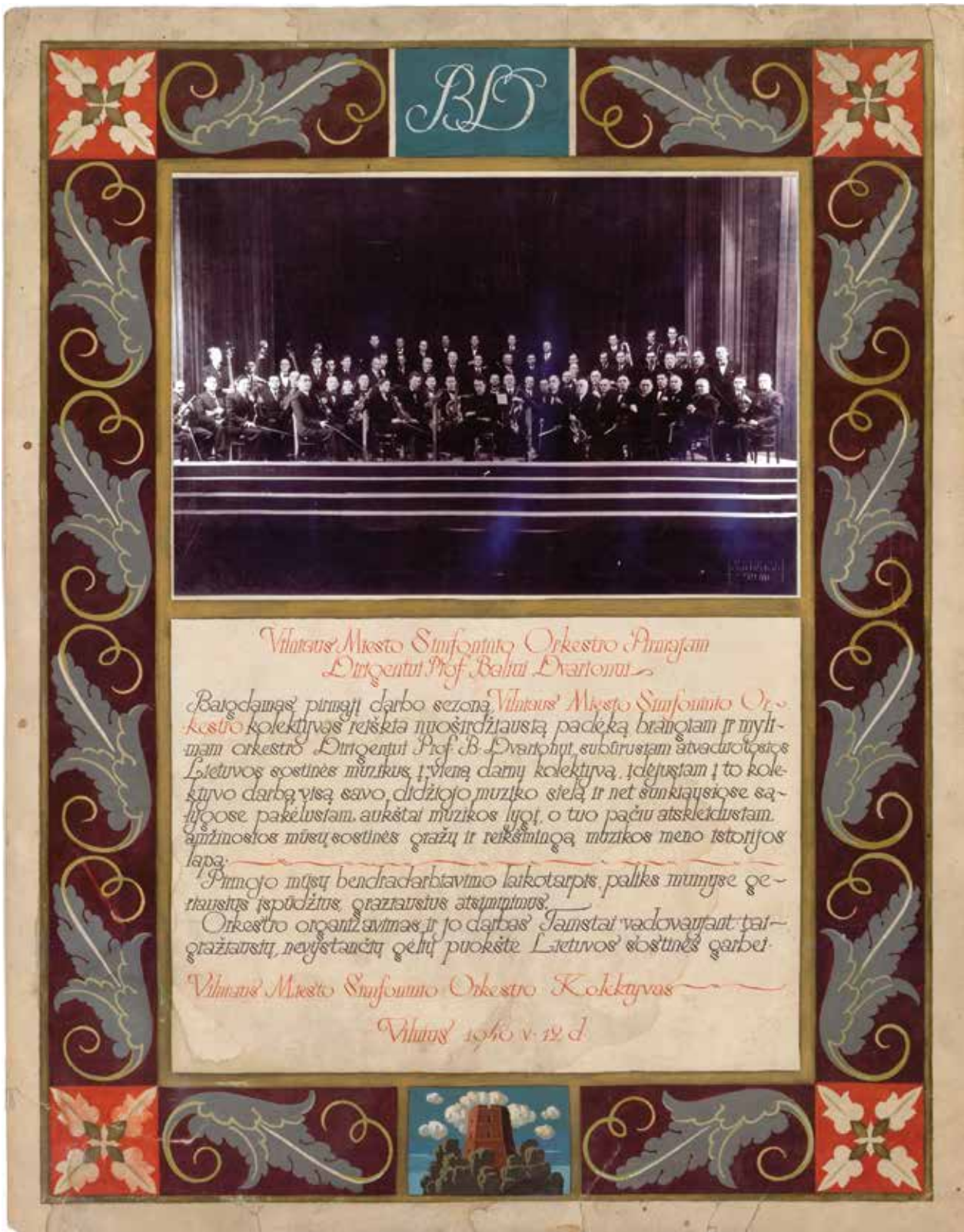
Padėkos raštas. 1940, gegužės 12.