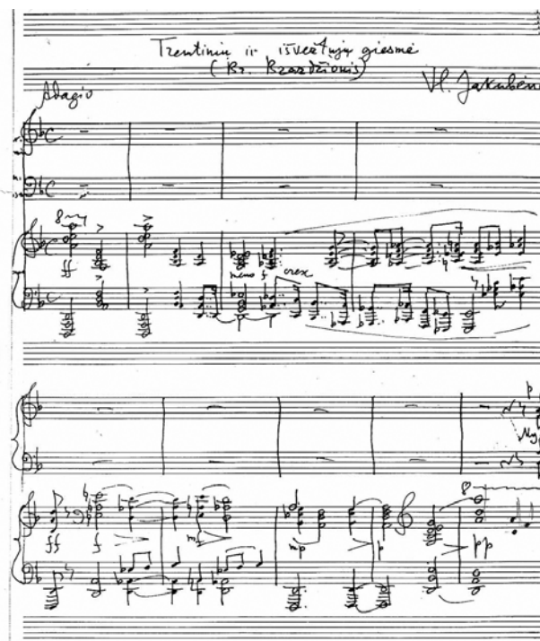
Vladas Jakubėnas. Tremtinių ir išvežtųjų giesmė. 1956. Rankraščio fragmentas

reguliuojančios rankos... Gerą naujausios tenykštės muzikos pavyzdį matėme Giedrės Kaukaitės koncerte atlikto F. Bajoro „Sakmių siuitoj“ 7 .