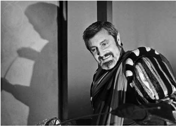
Mefistofelio vaidmenyje (Charles'io Gounod opera „Faustas“).

Niujorko „Metropolitan Opera“ galiojusią darbo etiką bei geranorišką administraciją, kai teatre visi susivienydavo dėl kokybiško spektaklio.