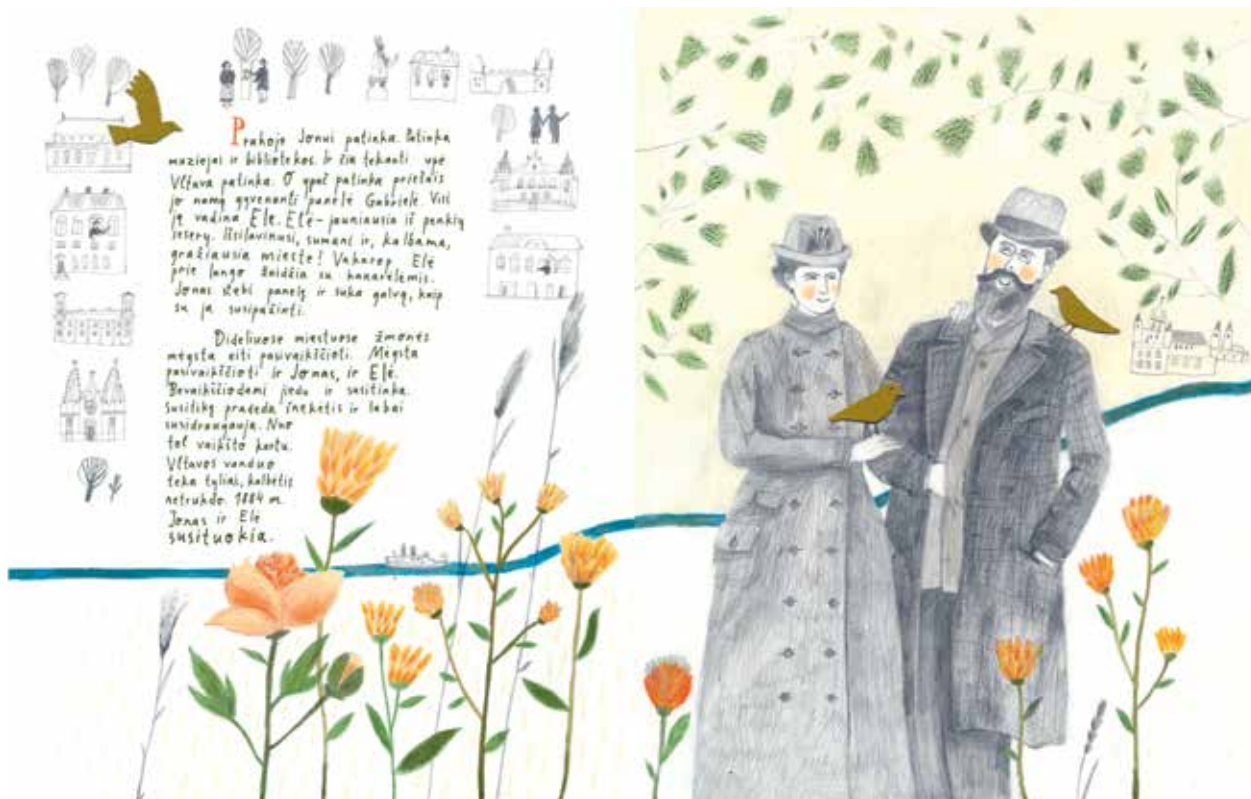
Jonas Basanavičius su žmona Eleonora Mol.