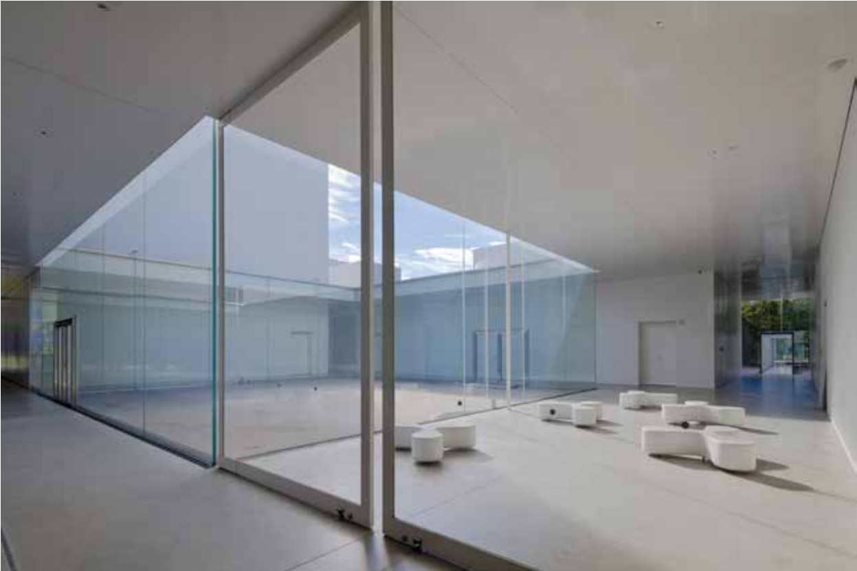
XXI amžiaus šiuolaikinio meno muziejus Kanadzavoje.

nomasi idėjomis, patirtimis, vieta, kurios erdvės ir vertybės mažina atotrūkį tarp meno kūrinio ir žiūrovo, kadangi menas tampa kasdienio gyvenimo dalimi. Tai darome įvairiais būdais: nuo parodų iki edukacinių programų, įskaitant ypatingus užsiėmimus vaikams bei plačiajai visuomenei atviras programas.