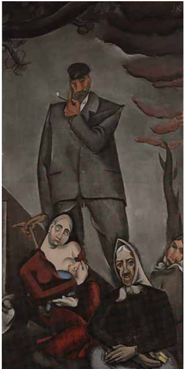
Jēkabs KAZAKS. Pabėgēļi. 1917. Latvijas nacionālais dailēs muzejs