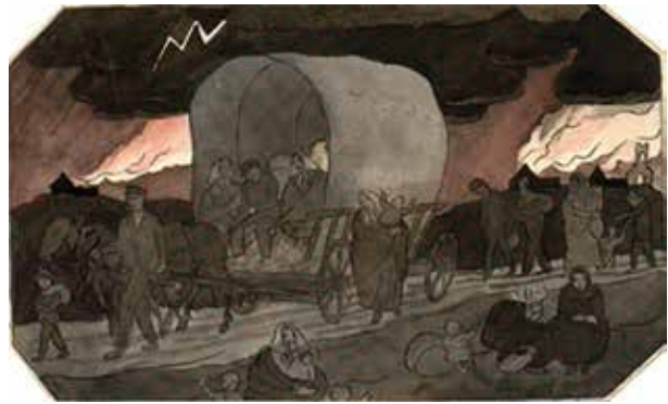
Jāzeps GROSVALDS. Pabėgēļi. Eskizas plakatui, kurį uzsakē Centrinis Latvijas pabēgēļu komitetas. 1915. Latvijas nacionālais dailēs muzejs

Tačiau ne kas kita, o to meto architektūra palieka giliausią pėdsaką istorijoje. 1936-aisiais įsteigiama Architektūros komisija, kurios prezidentu tampa Ulmanis! Jos šūkis, kaip ir visur kitur – latviškumo ugdyimas.