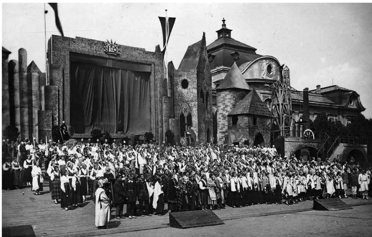
Atgimimo festivalis. Ryga, 1934, liepa

Tuo metu suklesti architektūra, ji žengia ranka rankon su vis stiprėjančia kova už kokią nors autonomijos formą. Ryga tampa moderniu metropoliu, kuriame naujoji Latvijos buržuazija nori gyventi prabangų visuomenės gyvenimą, apsupta komforto ir modernios aplinkos.