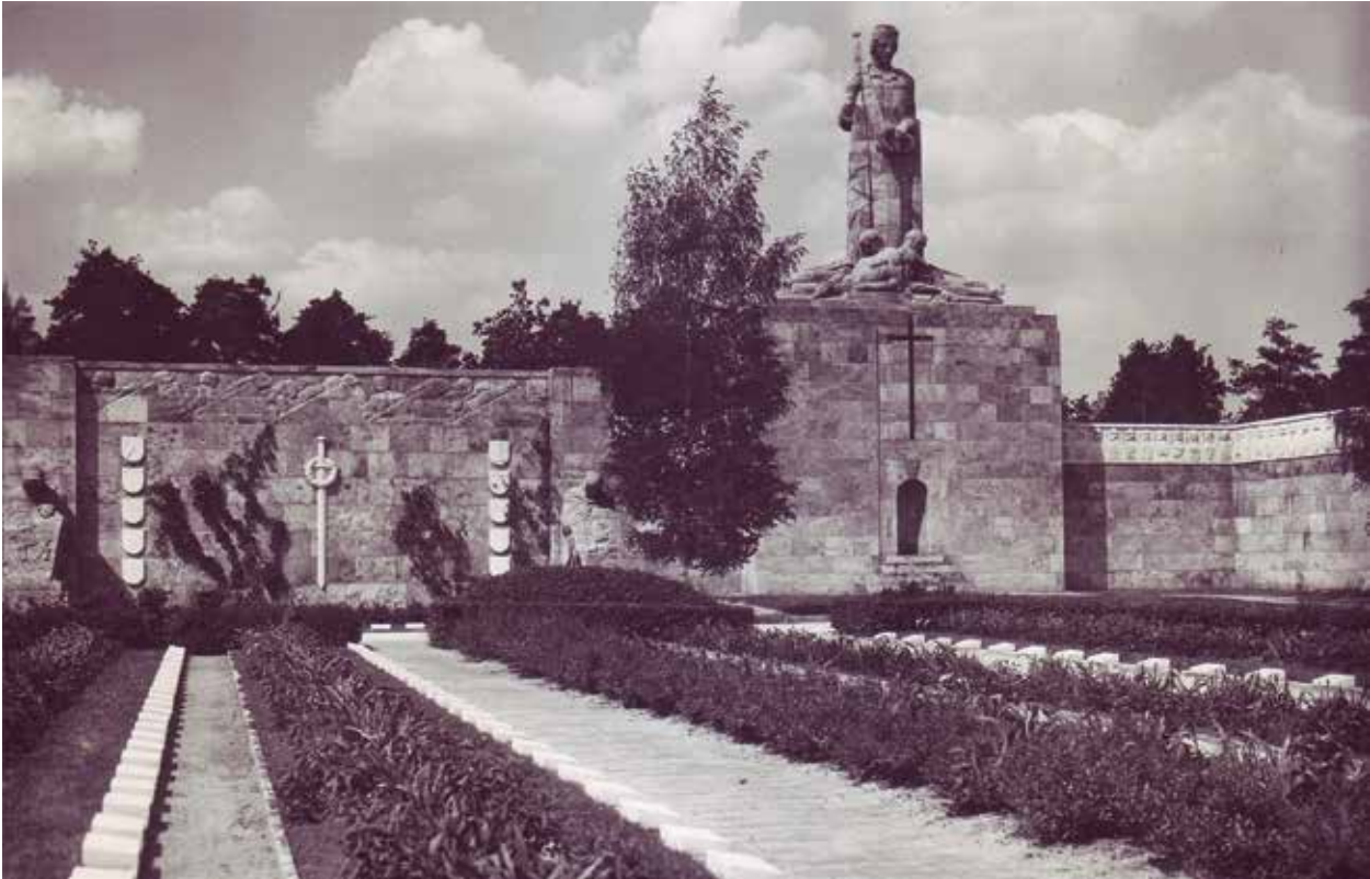
Kārlis ZĀLE. Brolių kapinės. Ryga, 1936

Apibendrinant galima teigti, kad šiuo atveju itin įdomi yra meno kryptių ir tautos santykių evoliucija.