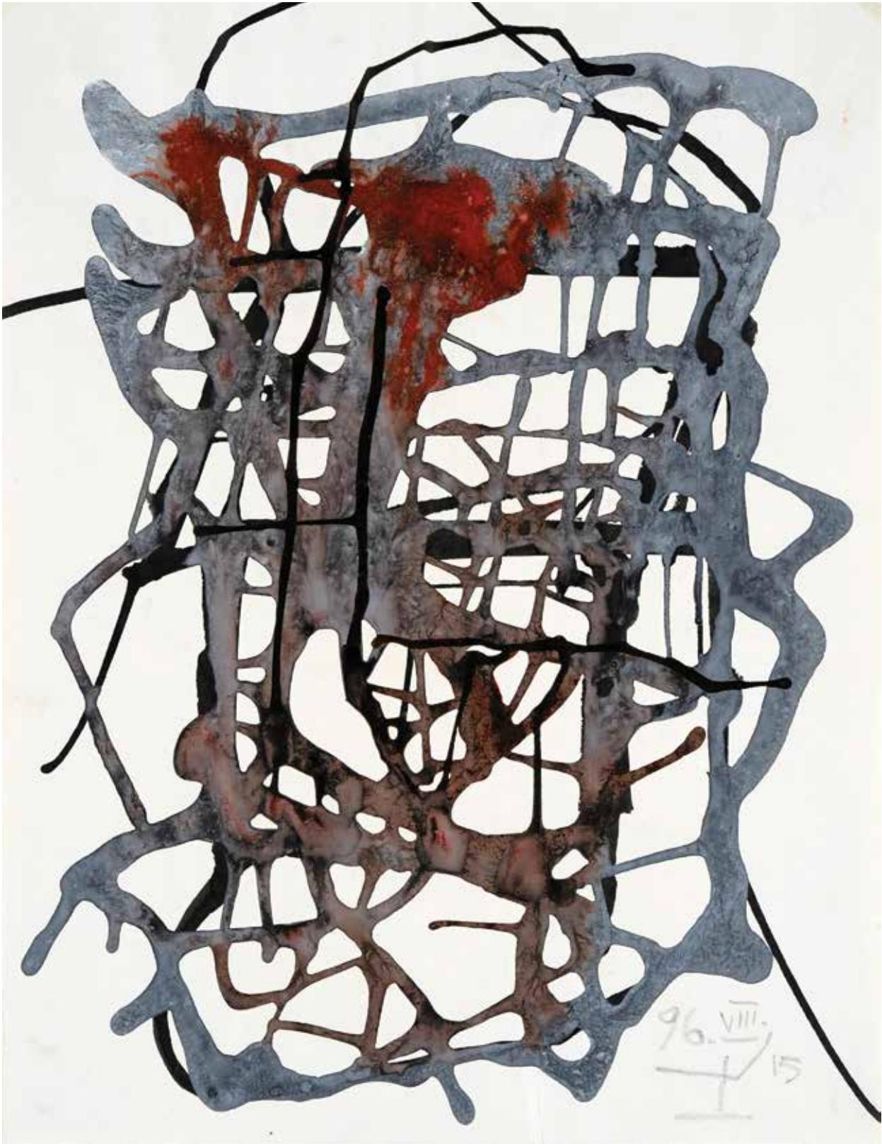
Vytautas ŠERYS. 96.VIII.15. Popierius, mišri technika, 53 x 43 cm. Dailininko šeimos nuosavybė.