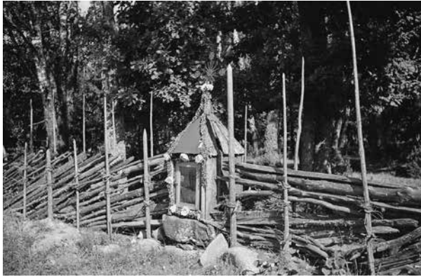
Koplytėlė kelyje Ketūnai–Mitkaičiai. 1938.