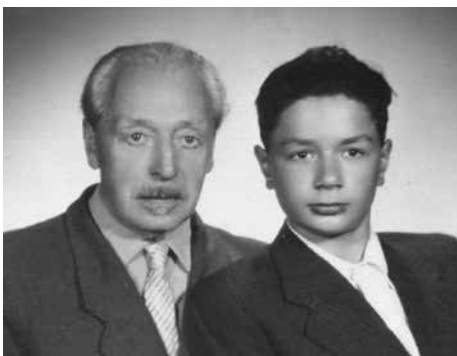
Aš su tėvu. 1958. Šeimos archyvas

Vilniuje mokiausi rusų 6-ojoje vidurinėje mokykloje. O po metų, kai baigiau penktą klasę, atėjo džiugi žinia – tėvą paleidžia! Tai įvyko 1956-ųjų liepą.