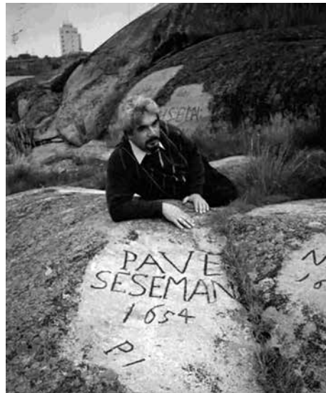
Aš ant riedulio su protėvio autografu Suomijos įlankoje. 1990.

tėvo mokslinį prestižą ne tik Lietuvoje, bet ir išgarsinti jį kaip mokslininką visoje Europoje.