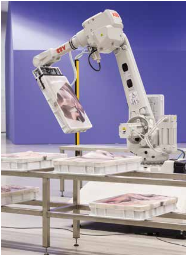
Pakui Hardware (Ugnius GELGUDA ir Neringa ČERNIAUSKAITĖ), Dvejojanti ranka, 2017. Industrinis ABB IRB 2600 robotas, transportavimo dėžės, UV spauda ant silikono, vaizdai iš NASA skaitmeninio archyvo, PVC plastikas, silikoninės gumos diržai, betonai, nerūdijantis plienas. Autorių nuosavybė. Paroda „Miesto gamta: pradedant Vilniumi“ Nacionalinėje dailės galerijoje.

savybė jausti, besiskleidžianti meno patirčių daugyje? Ar meno – tiek kūrybos, tiek patyrimo požiūriu – reikia mokytis, galima išmokti? Ar išmokstama?