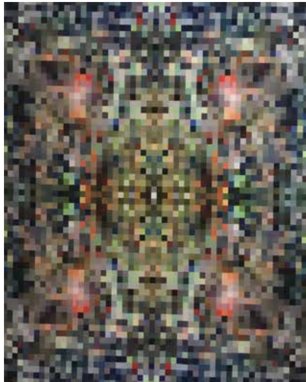
Renata MALDUTIENĖ. Vogtos spalvos I. 2017. Kompiuterinės grafikos technika, sportinis trikotažas. 170 x 136 cm