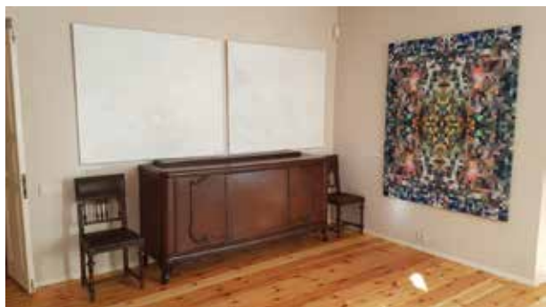
Deimos Katinaitės ir Renatos Maldutienės parodos „Spalvos Čiurlioniui“ fragmentas. Čiurlionio namai, Vilnius. 2017.