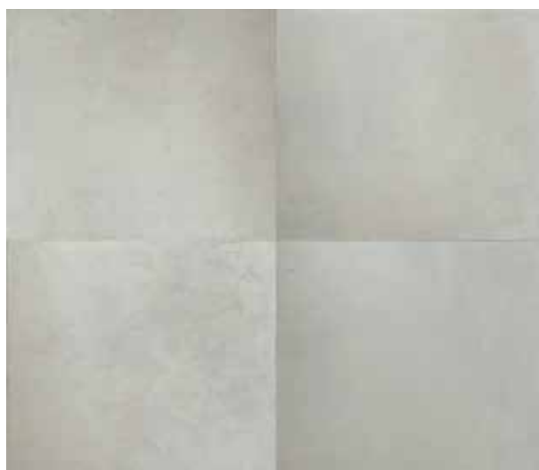
Deima KATINAITĖ. Preludai Čiurlioniui I, II. 2016. Drobė, aliejus. 240 x 280 cm