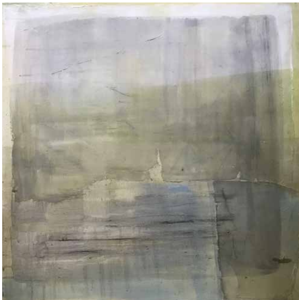
Deima KATINAITĖ ir Renata MALDUTIENĖ. Žingsnis. 2017. Drobė, aliejus, markeriai. 55 x 55 cm