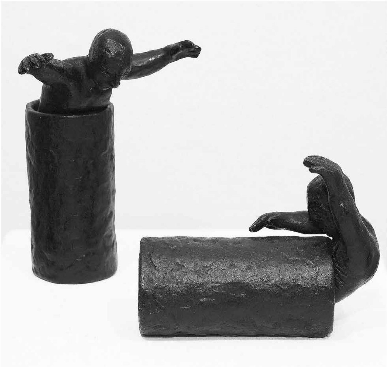
Beth LAURIN. Skulptūra II ir III. 2006.